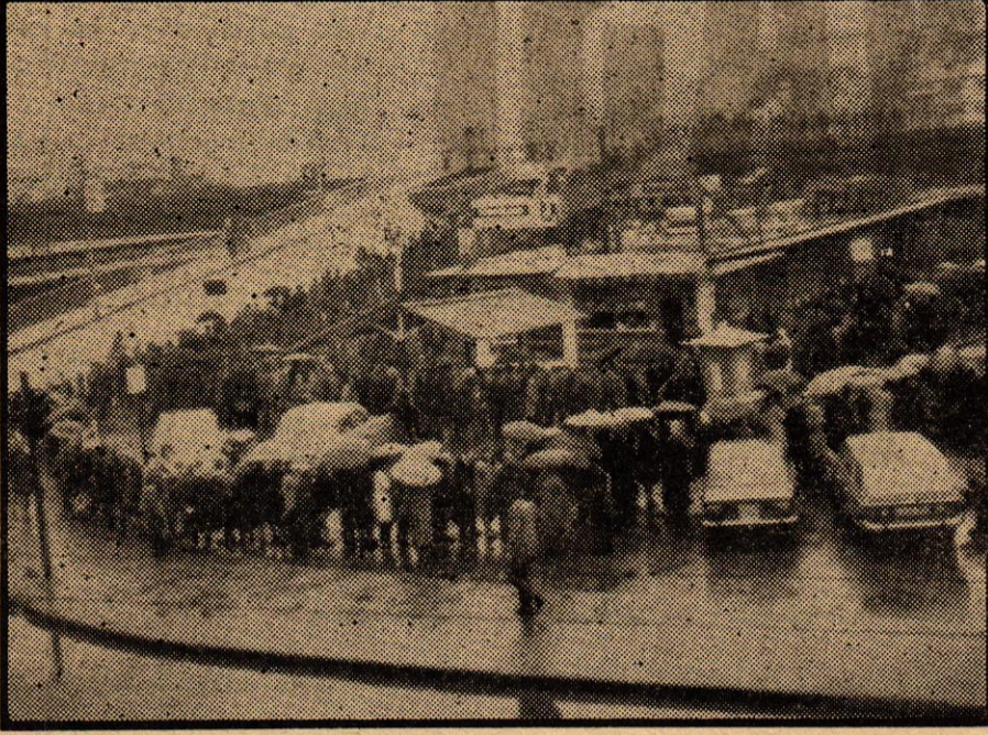
ZONGULDAK'DA YAĞ KUYRUĞU