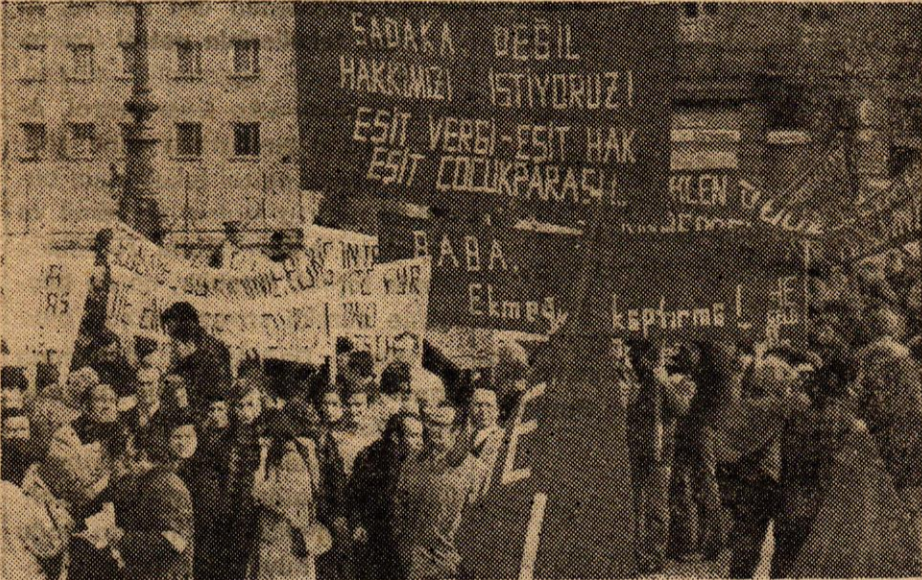
ALMANYA'DA YABANCI İŞÇİLERİN ULUSLARARASI DAYANIŞMASI. İŞÇİLER ÇOCUK PARALARININ KESİLMESİNİ PROTESTO ETTİLER.